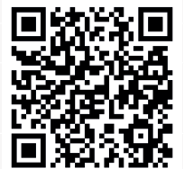
QR-Code scannen und Video zum SMART-BIT sehen